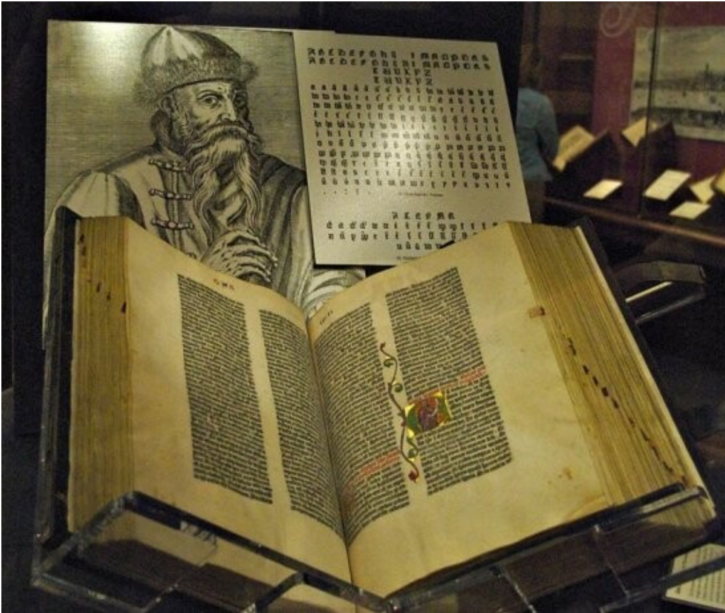
Il primo libro stampato da Gutenberg, la Bibbia 1456

Fino agli anni sessanta del secolo scorso i media si sono moltiplicati ed è cambiato il modo di trasmettere le notizie. Tutti i media, cioè giornali, radio e televisioni rappresentavano gli strumenti ideali per la comunicazione di massa, erano gestiti da industrie diverse ed avevano utenti variegati.