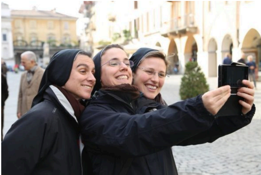
Suore francescane missionarie di Gesù Bambino durante una missione giovani.

Più che insegnamenti o dottrine i giovani oggi hanno bisogno di un vangelo incarnato e sperimentare che il Signore non rifiuta niente di ciò che abita le nostre vite, fosse anche un luogo digitale.