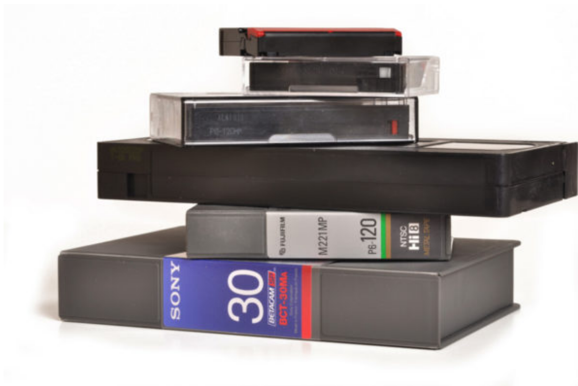
I tapes: i media degli anni '80 e '90

E invece ancora una volta la storia ci stupisce perché il brano è uno stralcio, sì del Messaggio per la Giornata Mondiale delle comunicazioni sociali, ma quello del 1993, che portava il titolo «Videocassette e audiocassette nella formazione della cultura e della coscienza» .