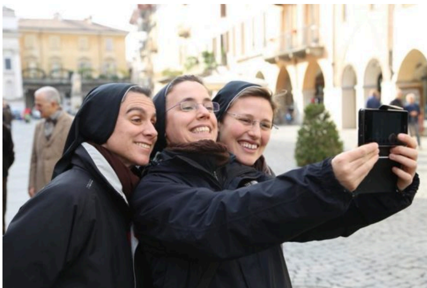
Suore francescane missionarie di Gesù Bambino durante una missione giovani.

Più che insegnamenti o dottrine i giovani oggi hanno bisogno di un vangelo incarnato e sperimentare che il Signore non rifiuta niente di ciò che abita le nostre vite, fosse anche un luogo digitale.