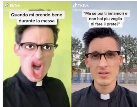
Il prete influencer

social perché dovevano tener chiuse, necessariamente, le chiese» [2] .