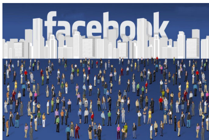
«Amici» di Facebook

contatti di Facebook sono persone che effettivamente desiderano avere un rapporto di amicizia e relazioni consistenti, possono essere sufficienti al bisogno di cura che l'essere umano porta con sé? [9]