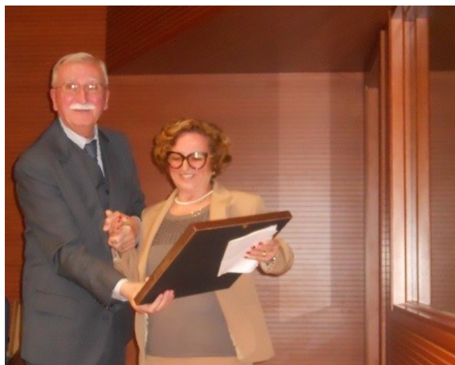
le associazioni premiate