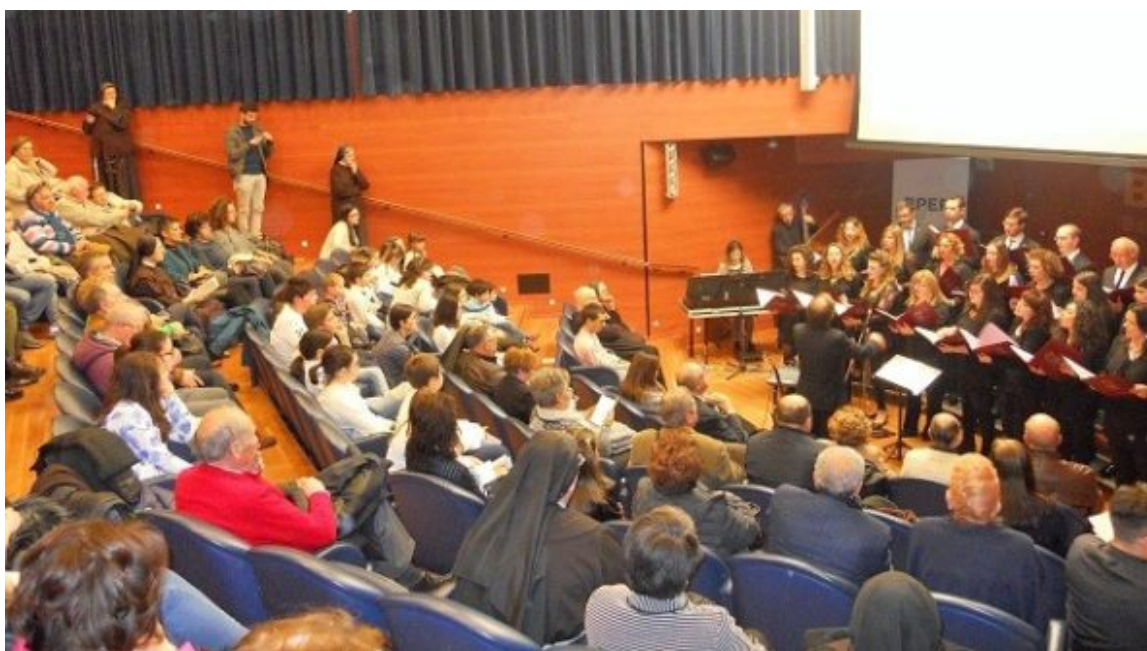
il Concentus Serafino Aquilano

ultimi de l'Aquila di fine '800. Il suo ricordo diventa così occasione per ritrovarsi, riconoscere e celebrare la carità di tanti che nel silenzio fanno gesti di bene verso chi maggiormente è nel bisogno. L'intera serata è, inoltre, accompagnata da intermezzi musicali del Concentus Serafino Aquilano , gruppo vocale e strumentale diretto dal M° M. Fabrizi.