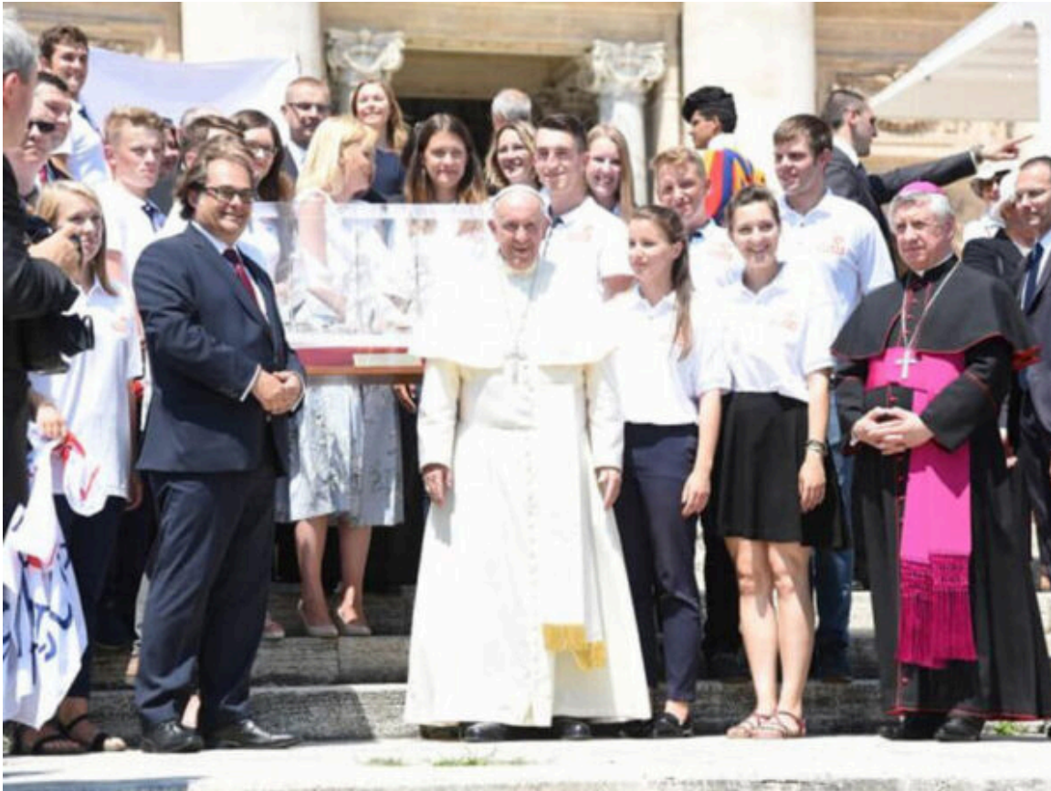
Chiesa con giovani

Al di là di tutte le definizioni, i giovani sono la parte più dinamica di chiesa e società. Il periodo della gioventù è la fase più affascinante della vita. Quando pensiamo ai giovani, facciamo riferimento a tutto ciò che è bello nella vita, come la moda, lo sport, l'arte, i media, le nuove tecnologie, il divertimento, l'avventura, le relazioni, l'idealismo, la creatività e i grandi sogni. I giovani protagonisti della Chiesa devono fare le proprie responsabilità e quindi è imperativo che la gioventù non sia vista solo come un'età, ma come uno stato d'animo e un atteggiamento.