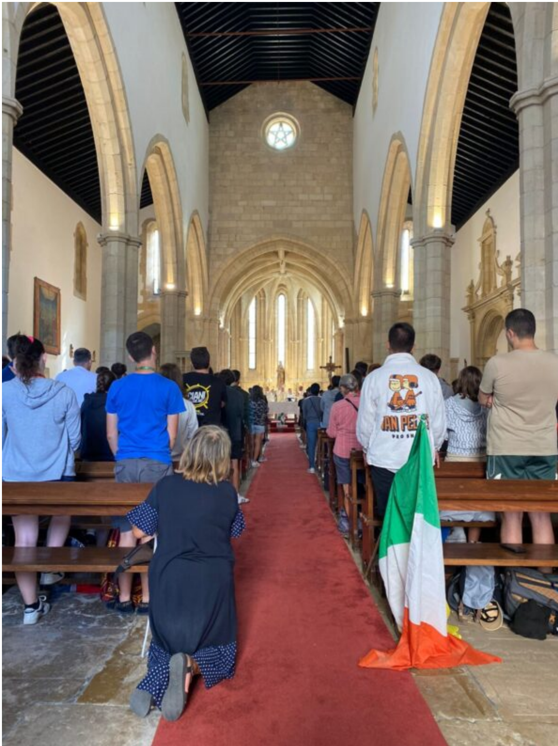
Catechesi San Giulio GMG Tomar