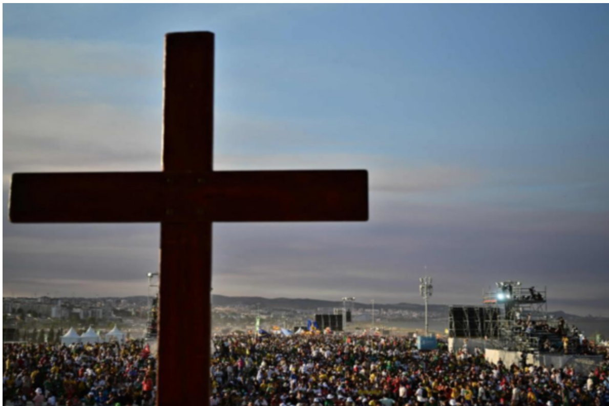
Un milione e mezzo di giovani alla Veglia con il Papa

Sarà sempre ricordato che la GMG di Lisbona 2023 ha revivificato lo spirito di andare avanti. I momenti di preghiera, i discorsi, l'amicizia e l'entusiasmo che ha tirato fuori intuizioni e motivazioni di vita. Che non era solo di giovani ma anche di famiglia, e di più piccoli. Sarebbe stato aperto a tutti in paragone con altre GMG secondo coloro che hanno già fatto la medesima esperienza degli anni precedenti.