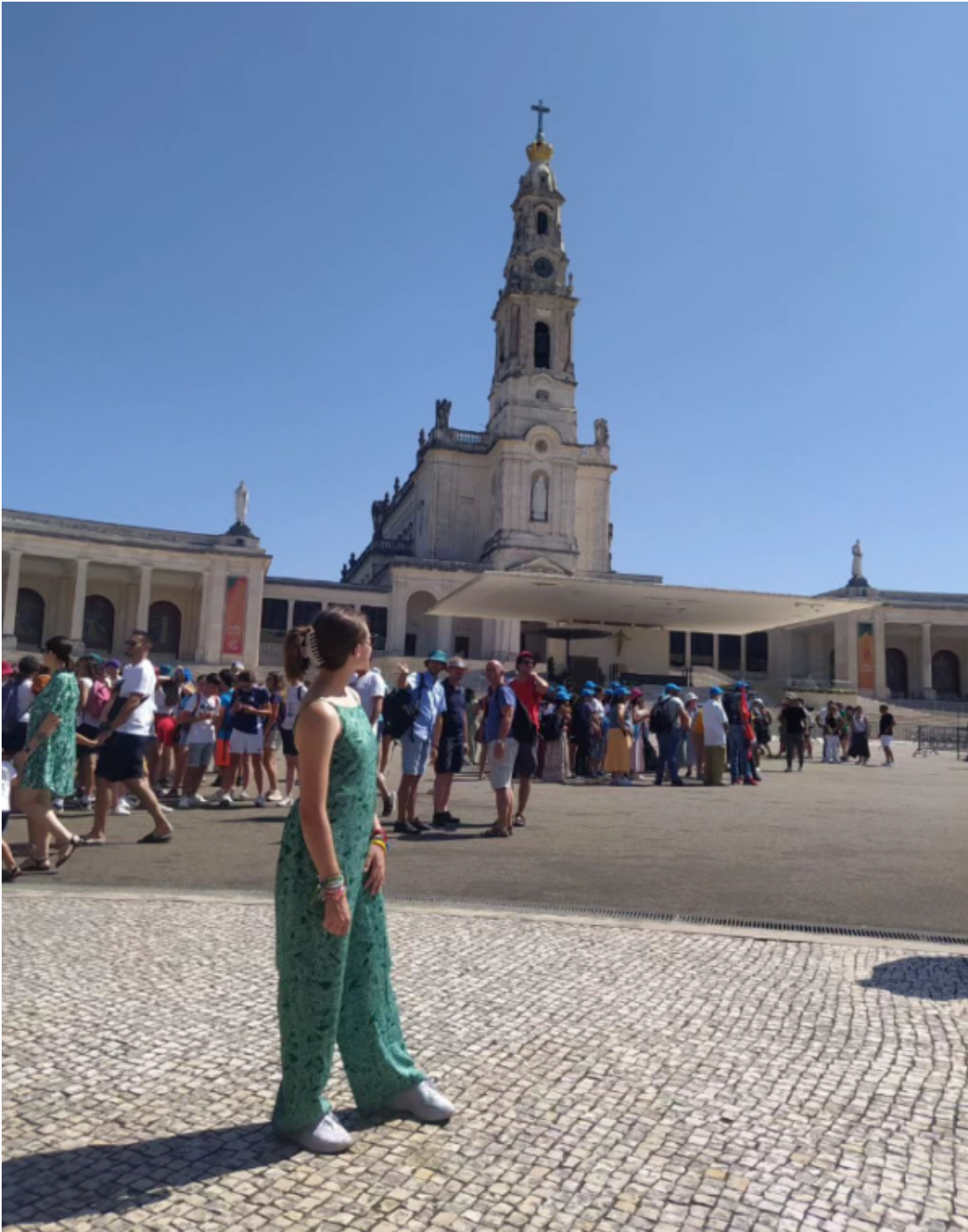
Esplorare Fatima e incontro con gli altri.