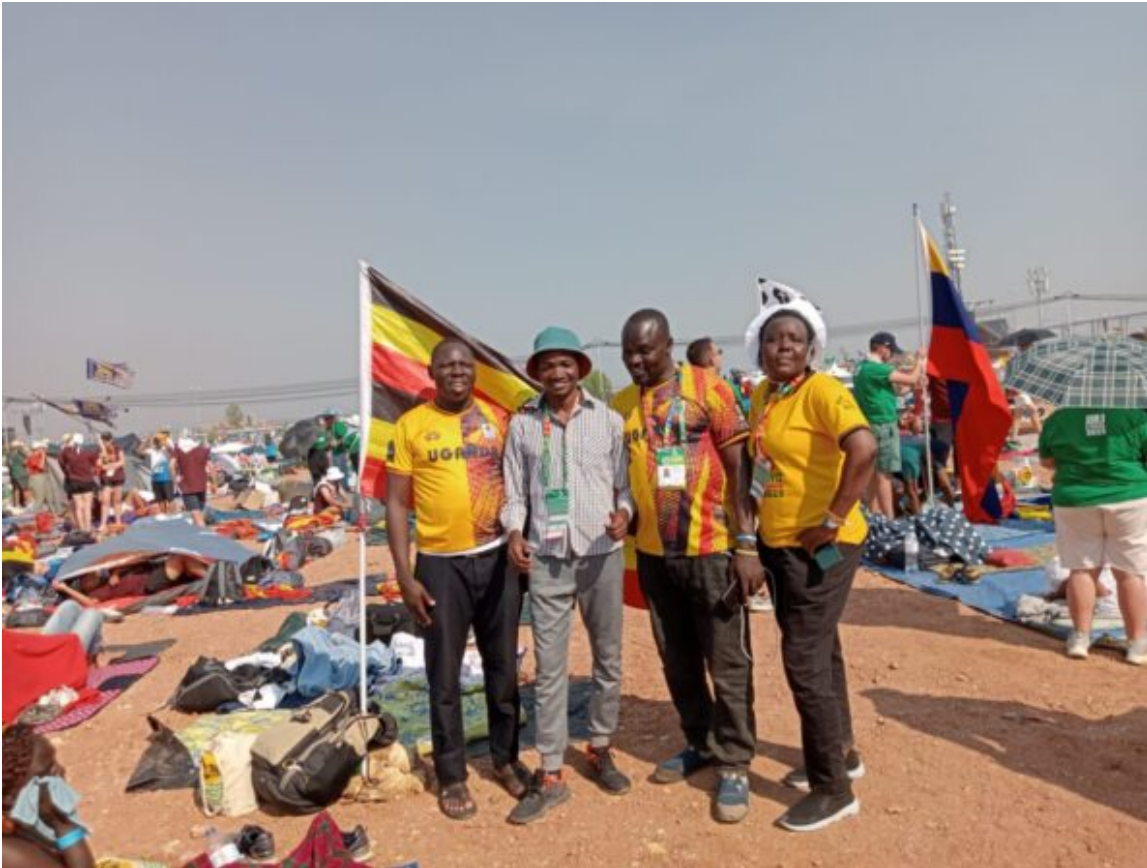
Yowasi Incontra i propri compaesani Ugandesi