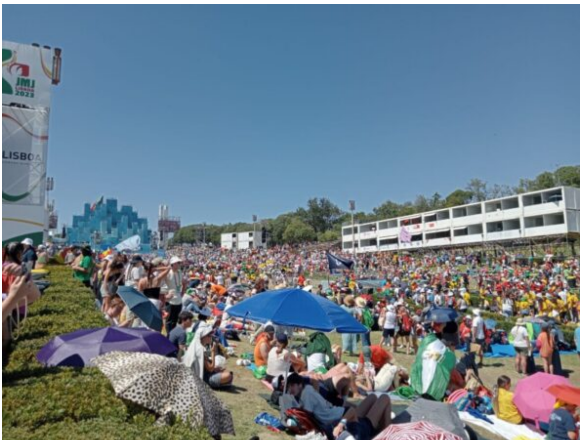
Una sveglia nella mattinata della domenica dopo la veglia