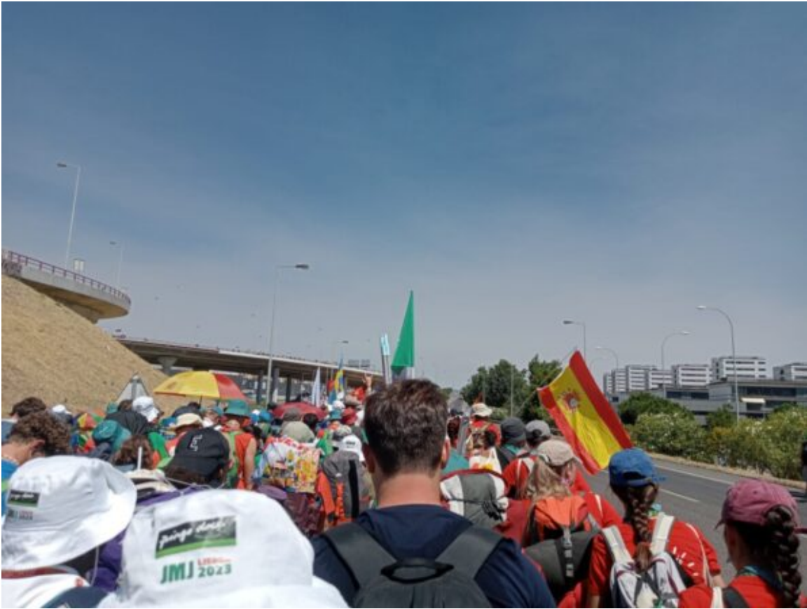
Veglia GMG al Parco Tejo Lisbona 3.jpg