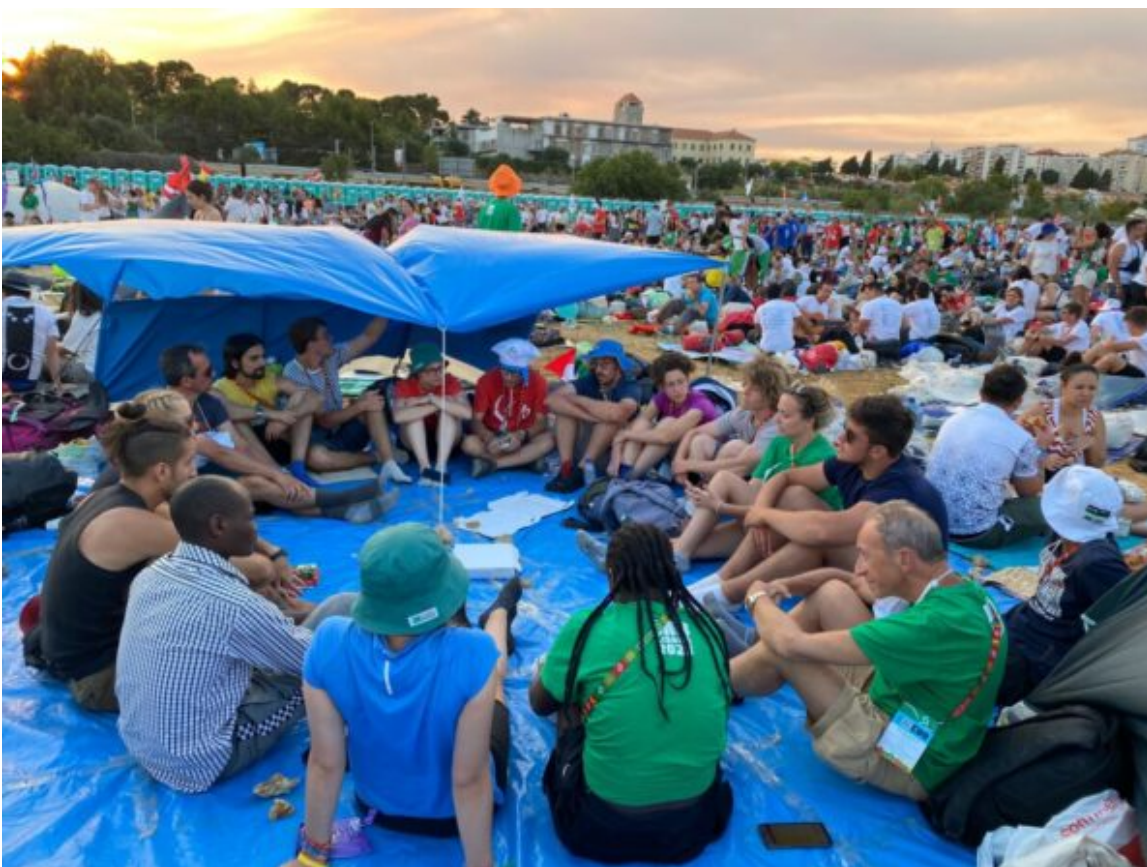
Riflessione, Condivisione, Ascolto, Preghiera San Giulio GMG Lisbona