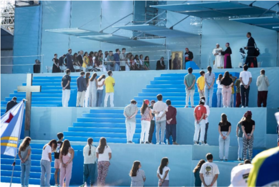
Un momento della Via Crucis a Lisbona - Cristian Gennari

Il messaggio centrale della via crucis era basato sul testo di Luca 1, 39; <Maria si alzò e si mise in cammino. Gesù imparò da sua Madre: mentre portava la Croce, Gesù dovette alzarsi e rimettersi in cammino. Signore, insegna a noi giovani ad alzarci e andare avanti. Anche quando la vita è difficile>[4].