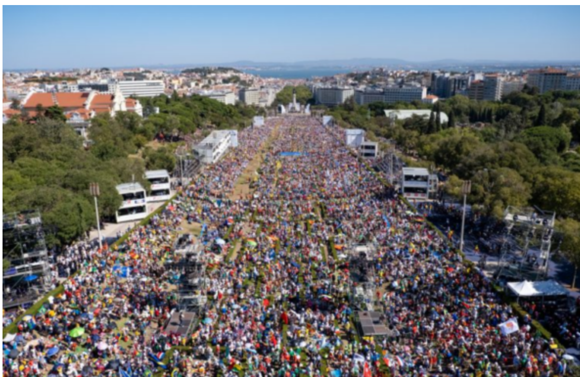
Il Parque Eduardo VII

I discorsi del Papa hanno mostrato un grande sforzo della chiesa che cerca sempre di avvicinarsi alla vita dei giovani, un invito di dialogo tra vecchi-giovani, i nonni con i nipoti. Una ispirazione alla fecondità dei giovani. Il popolo gortuguese che con piccoli gesti di accoglienza, di saluti, sorriso e abbraccio ha altrettanto colpito tutti.