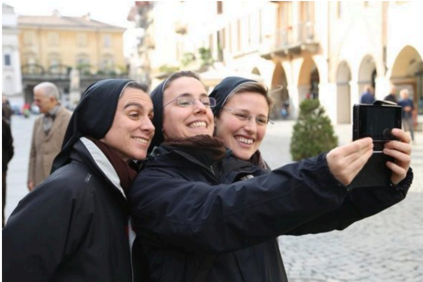
Suore francescane missionarie di Gesù Bambino durante una missione giovani.