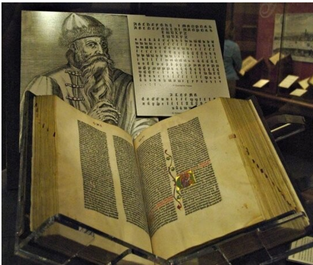
Il primo libro stampato da Gutenberg, la Bibbia 1456

Fino agli anni sessanta del secolo scorso i media si sono moltiplicati ed è cambiato il modo di trasmettere le notizie. Tutti i media, cioè giornali, radio e televisioni rappresentavano gli strumenti ideali per la comunicazione di