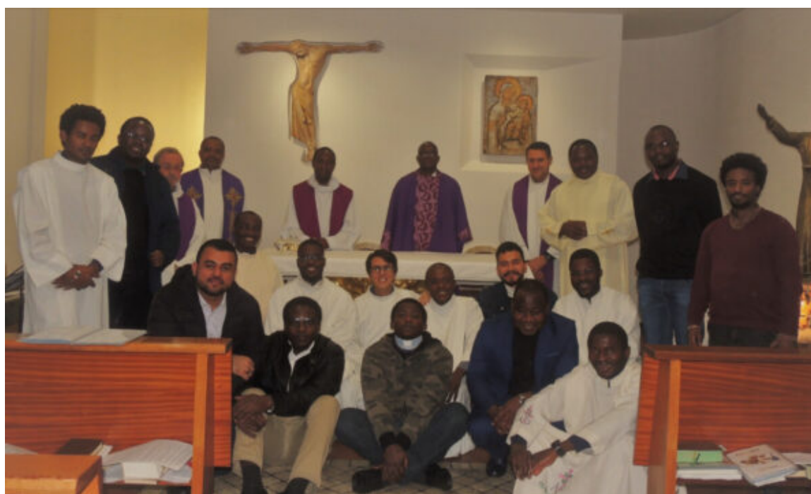
Dalla forma dell'Eucaristia

Gesù si è spezzato sacrificando se stesso per la nostra salvezza, così anche noi nel partecipare in questo mistero pasquale siamo chiamati a imparare da Gesù Cristo di essere disponibile per l'altro dando noi stessi per gli altri con lo scopo dell'unità intima pane spezzato durante l'ultima cena e ha costituito la chiesa sull'Eucaristia. Rivitalizzati con l'Eucaristia ed essendo uniti alla fonte della carità piena; cioè ricevere per potere dare noi stessi agli altri.