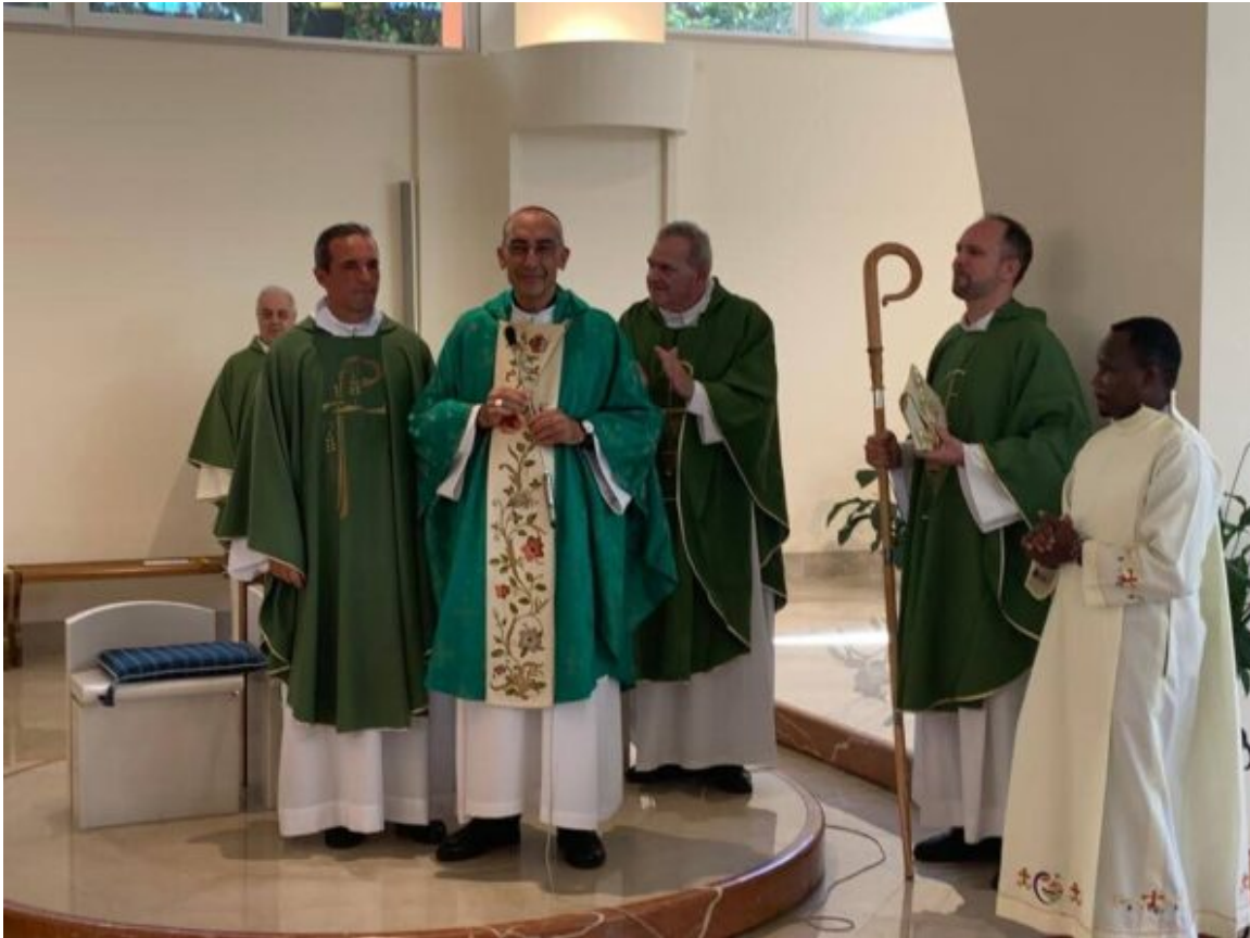
Mons. Baldassare Reina

Padre Raffaele (che ha fatto il Cerimoniale) ha commentato brevemente che la celebrazione Eucaristica e la liturgia in generale è stata bella e molto coinvolgente. Così ha detto: