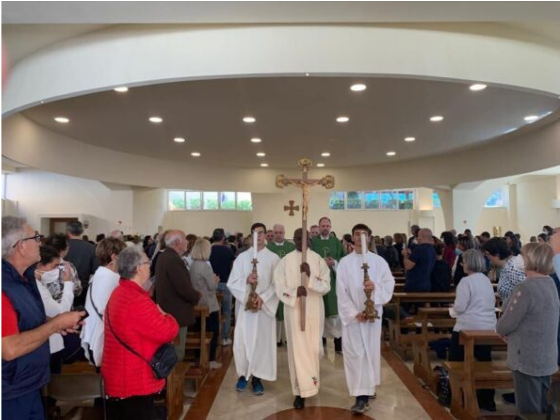
Congedo messa in processione