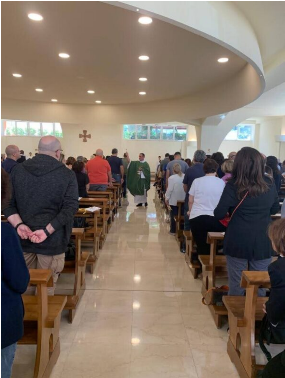
Benedizione con Acqua Santa